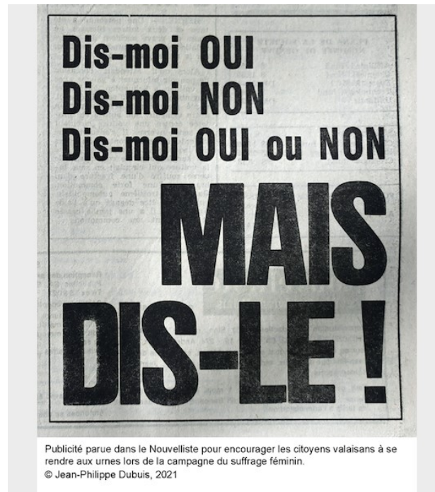
Publicité parue dans le Nouvelliste pour encourager les citoyens valaisans à se rendre aux urnes lors de la campagne du suffrage féminin.