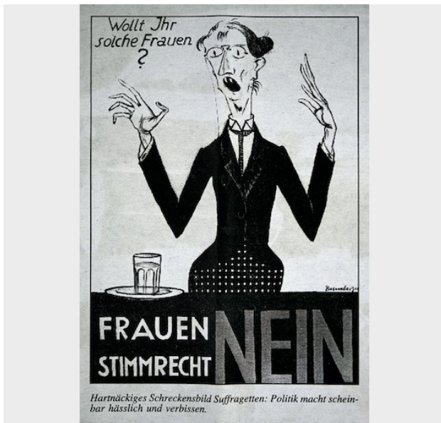
Reproduction d'une affiche (1920) des opposants au suffrage féminin, publiée dans le Walliser Bote du 7 février 1996. Plakat «Frauenstimmrecht NEIN» (1920), Walliser Bote vom 7. Februar 1996. Reproduktion.